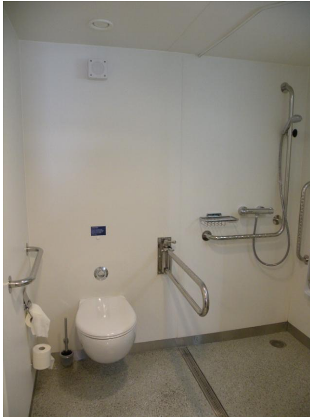
מאחזים משני צידי האסלה (המתקפל משותף גם למקלחת).